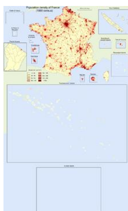
جمعیت شناسی (آمارگیری نفوس)

سیاست فرانسه بر محور دو گروه سیاسی متضاد است : جناح چپ ، سوسیالیستهای فرانسوی و جناح راست که قبلا برای " دوباره جمع شدن برای جمهوری " متمرکز شدند و حالا در پی وحدت برای حرکت بسوی محبوبیت هستند . در حال حاضر بخش اجرای بیشتر پیرامون گروه دوم شکل گرفته است .