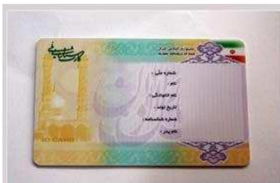
ز. کارت هویت یونان:

عواقبی هم در پی دارد، هریک از فرزندان متولد شده در ازدواج باطله همچنان بعنوان کودکان متولد شده در ازدواج در نظر گرفته می شوند.