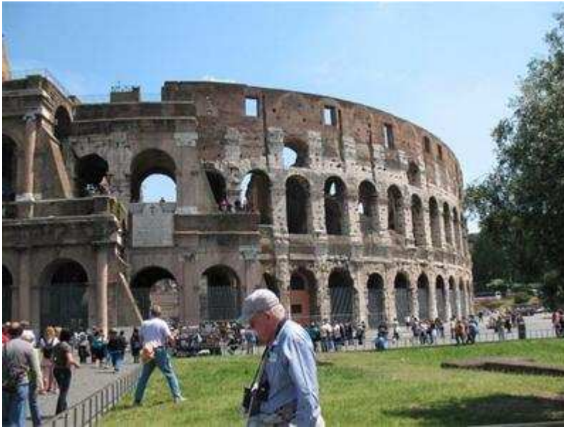
کتابچه اسناد خانوادگی

یونان قرارداد شماره ۱۵ را مبتنی به معرفی کتاب جهانی اسناد خانوادگی را تصویب نموده است در حالیکه از سال ۱۹۹۰ این کتاب در یونان وجود ندارد.